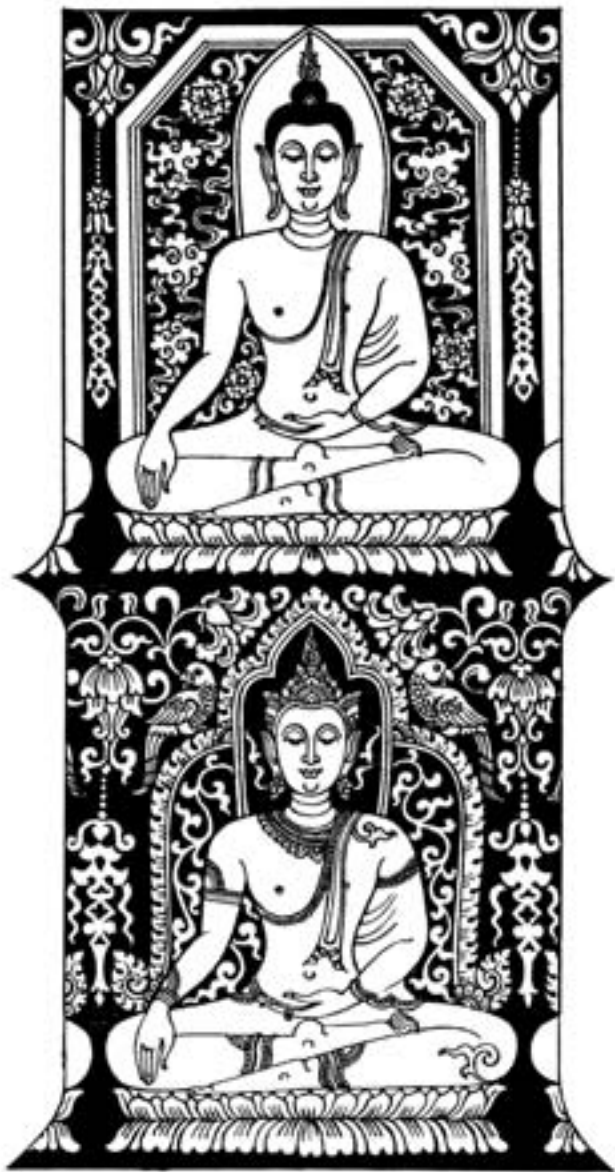
ภาพโดย พรศิลป์ รัตน์ชูเดช